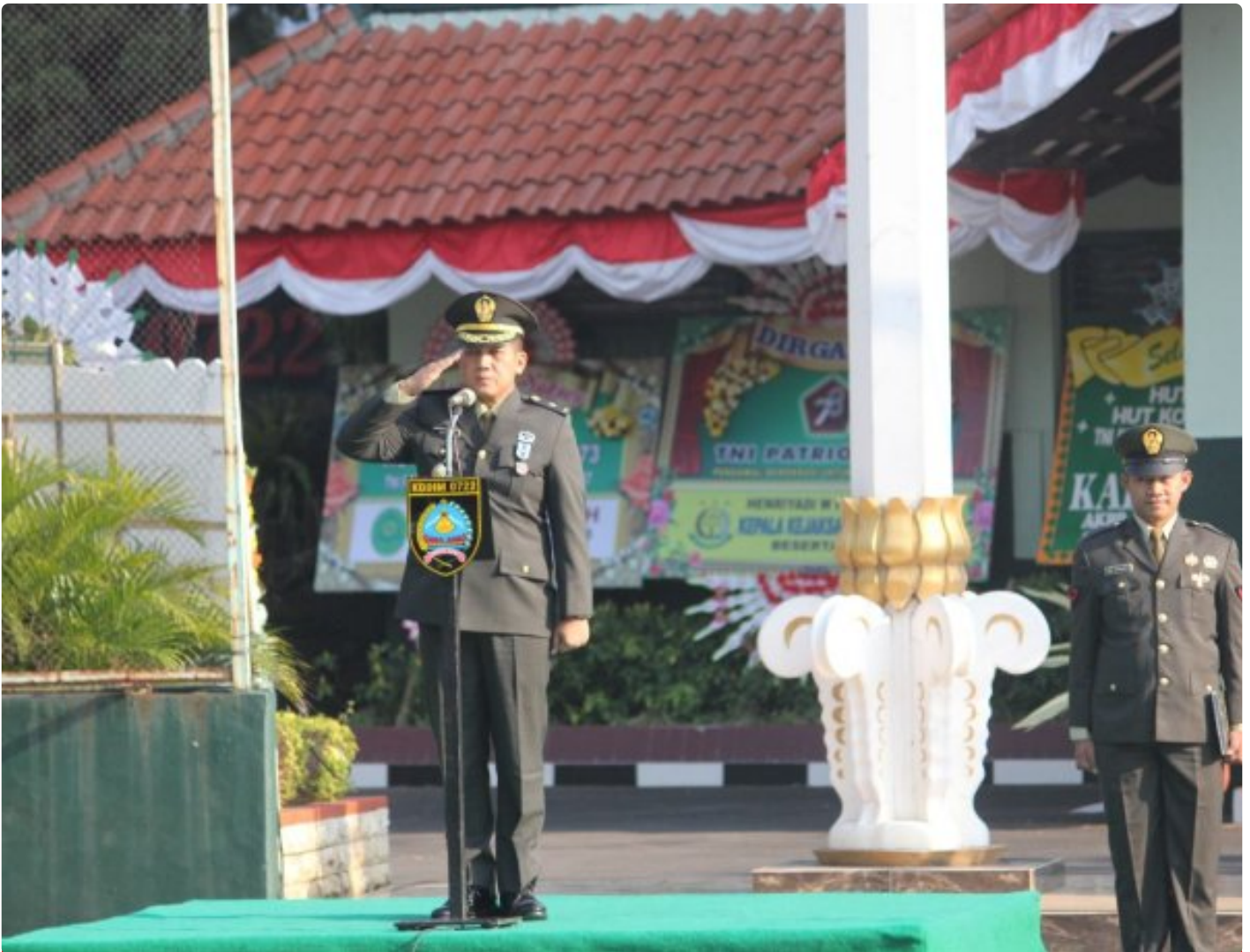
Peringati HUT Ke 78 TNI, Kodim 0722/Kudus Gelar Upacara

KUDUS - Komando Distrik Miliiter 0722/Kudus menggelar Upacara HUT Ke-78 TNI di halaman Makodim 0722/Kudus Jl. Jend. Sudirman No.39, Barongan, Kec. Kota Kudus, Kabupaten Kudus, dengan mengangkat tema TNI PATRIOT NKRI "Pengawal Demokrasi Untuk Indonesia Maju". Kamis (05/10/2023).